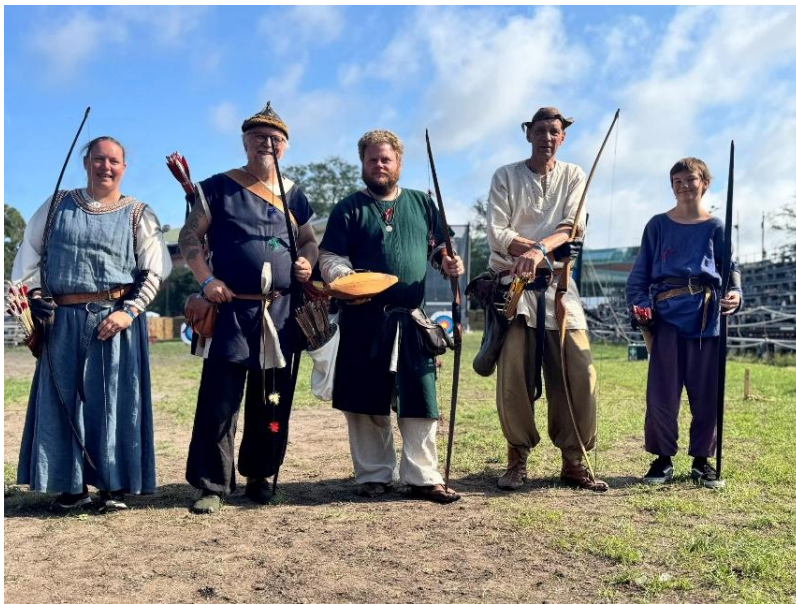
Vinnarna i Gutars Bågskyttars KM 2025.