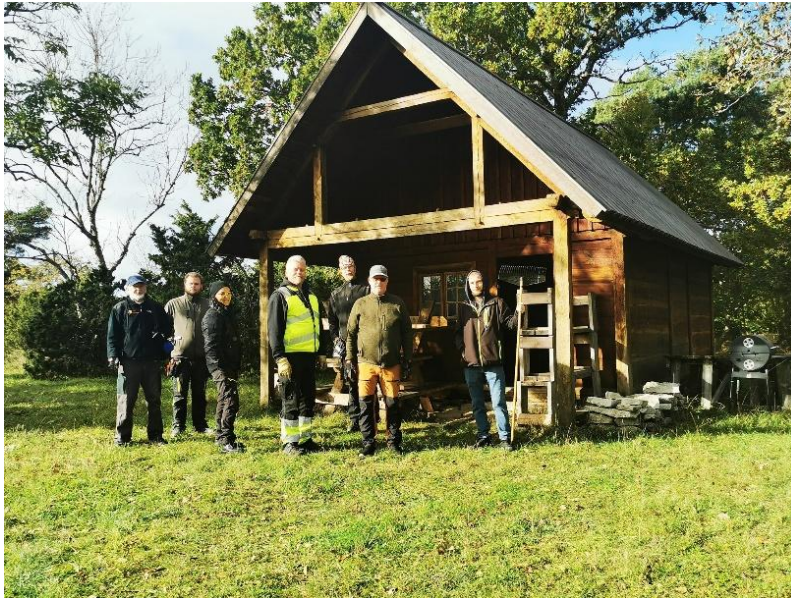
Bulhuset i Säcken.