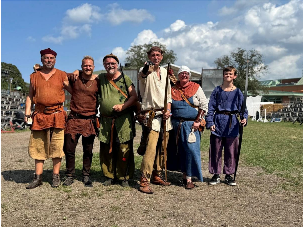
Stolta vinnare/skickliga skyttar.