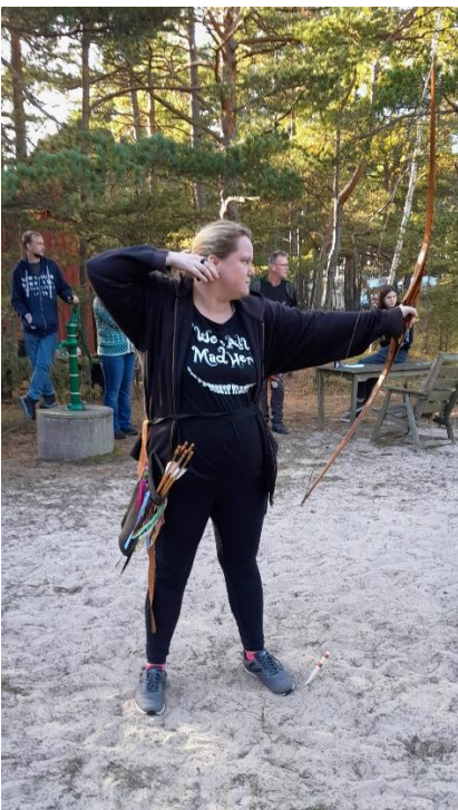
Chatrine tog hem ett särskytte.