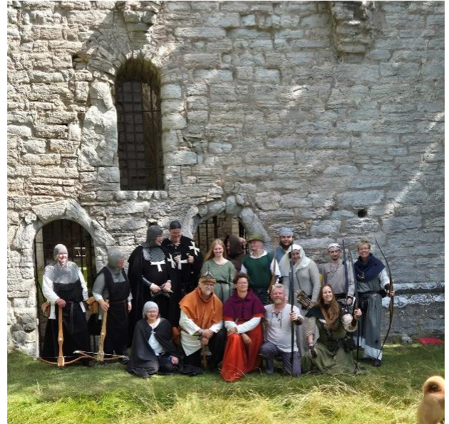
Robin Hood och hans glada vänner.