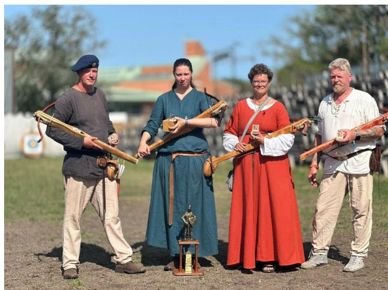
Gutars bästa armborstskyttar.