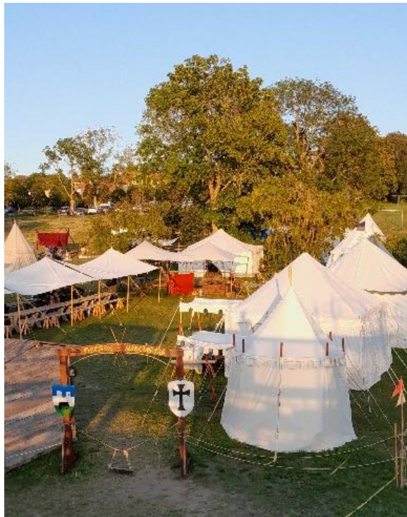
Gutars läger med ny portal.